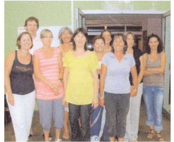
quelques membres du nouveau Conseil d'Administration